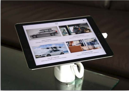
Zubehör und Teile in einer Werkstatt-Webseite