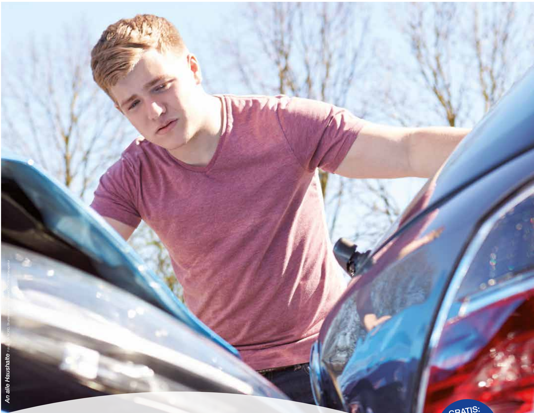
An alle Haushalte Foto: TÜV NORD, Shutterstock.com / pixelstudio Verlag&art

Unfallgutachten in Echtzeit Schneller im Bild mit dem TÜV NORD SofortGutachten