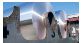
Wir bieten individuelle, auf Ihre Bedürfnisse zugeschnittene Lösungen