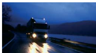
Ihre gut geschulten Angestellten arbeiten schneller und effektiver