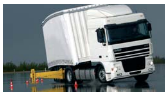
Gerne führen wir dynamische und statische Prüfungen direkt bei Ihnen vor Ort durch

Ob die Begutachtungen von Großraum- und Schwertransporten oder Expertisen im Falle eines Unfalls: Vertrauen Sie auf unabhängigen Sachverstand.