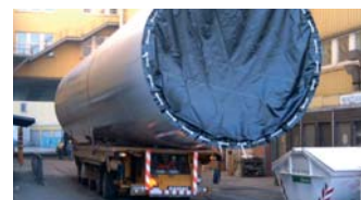
Unsere Sachverständigen begutachten Ihre Fahrzeuge für die Erteilung einer Ausnahmegenehmigung